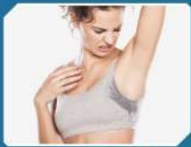
शरीर की दुर्गंध