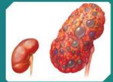
गुर्दे के रोग